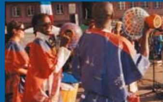
Wissenschaftsmarkt und interkulturelle Woche in Mainz